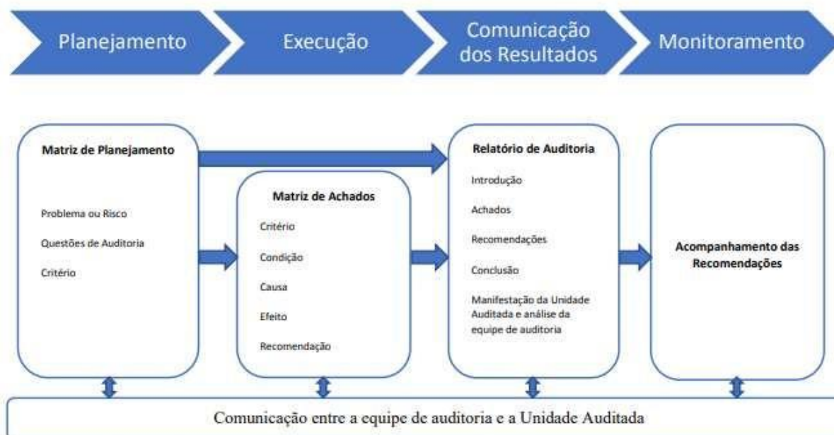
Figura 1 – Fluxo dos elementos do Relatório de Auditoria